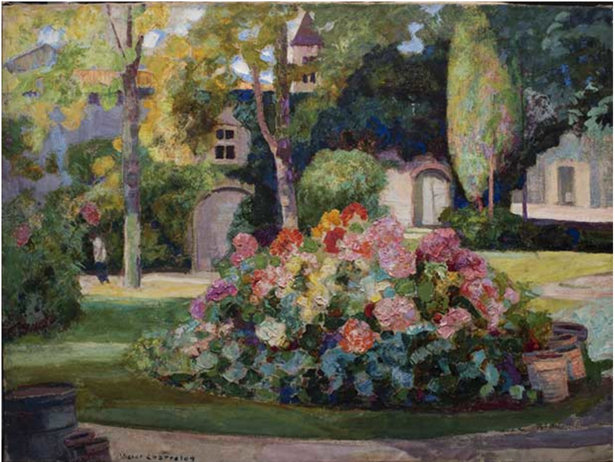
Victor Charreton, Fleurs dans le parc, 1933, huile sur toile, Signé en bas à gauche, 96,5 x 129,5 cm, estimé 5 000/7 000 €