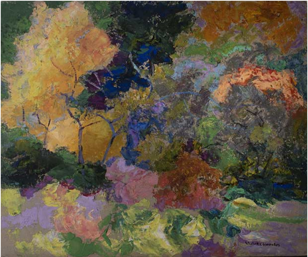
Victor Charreton, Massif polychrome, automne, huile sur carton, signé en bas à droite, 37,5 x 45 cm, estimé 1400/1800 €.